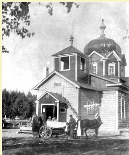
храм в честь Успения Пресвятой Богородицы