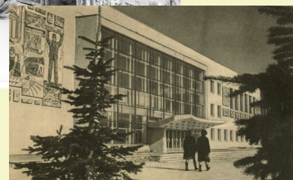
Проект учеников гимназии №13 «ПУТЕВОДНАЯ НИТЬ»